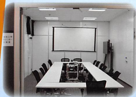
先端医工学研究センター会議室

共同研究の拠点として設置した姫路駅サテライトラボ(姫路駅直近)では、研究員、医産学連携・研究支援コーディネータが常駐し、共同研究の実施、共同研究や技術指導の相談を随時受け付けています。また、医療ビッグデータに役立つデータ解析・可視化計算機を備え、専門的な解析をサポートします。さらに、共同研究推進のための会議室も備えていますので、ぜひご活用ください。医工学研究開発に関するご相談は、お気軽に医産学連携・研究支援コーディネータにお問い合わせください。