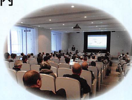
医療機器開発シーズセミナー

医産学官の連携促進を目的に、医工連携コンソーシアムを設立し、医工連携でご活躍の先生方を講師に招いた医工連携セミナー、国内外の第一人者に最先端の医工学技術を紹介いただく学術交流講演会を通して、コンソーシアムの輪が広がり、姫路を中心にした医工学の研究開発の活性化を図っています。ご関心がある方は、ぜひコンソーシアムへご加入ください。