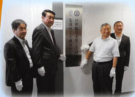
姫路駅サテライトラボ除幕式 (平成28年6月20日)

共同研究の拠点として設置した姫路駅サテライトラボ（姫路駅直近）では、研究員、医産学連携・研究支援コーディネータが常駐し、共同研究の実施、共同研究や技術指導の相談を随時受け付けています。また、医療ビッグデータに役立つデータ解析・可視化計算機を備え、専門的な解析をサポートします。さらに、共同研究推進のための会議室も備えていますので、ぜひご活用ください。医工学研究開発に関するご相談は、お気軽に医産学連携・研究支援コーディネータにお問い合わせください。